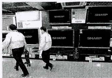
Sharp fabrica televisores LCD en Sant Cugat.

productivo de Viladecavalls (Vallès Occidental). En ese caso, el fabricante japonés traspasó las instalaciones a Ficos y Comsa Emte, que se centrarán en electrónica para el automóvil. El comité de empresa conocerá las condiciones del nuevo expediente temporal en una reunión que tendrá lugar el próximo lunes. La carga de trabajo prevista para los próximos meses es de 70.000 televisores LCD, inferior a la que se encargó en 2010. P5