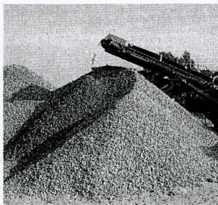
GRC dará el salto a dos puertos de China en 2011.

de la firma, Ramon Tella. GRC lleva un año trabajando en el mercado chino y se "centrará" en el sudeste asiático después de descartar otros destinos como Brasil, Haití y Chile. GRC, participada en un 45% por capital público y un 55% por empresas de la construcción, gestionó cinco millones de toneladas de tierras y escombros en 2010, año en el que facturó cinco millones. La empresa ha apostado además por los prefabricados y ha aumentado un 320% las toneladas tratadas para este fin. El reciclaje de tierras a partir de grandes obras como el AVE o la L9 han impulsado el negocio. P3